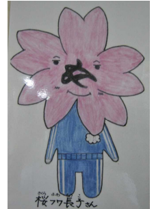
児童が考えたキャラクターです!

そんな中での、テーマ発表だったので、むしろ良い機会と捉え、7月13日(火)の児童朝会で「ふわふわ言葉」の意義について話をしたり、ゲームをしながらふわふわ言葉で応援する練習の仕方を示したりしました。今後も児童会活動と連動しながら、人との関わり方について考えていく一年間にしていきます。長者小学校に、「ありがとう」「うれしい」「たすかった」など、人を元気にする言葉が増えることを期待しながら取り組んでいきます。