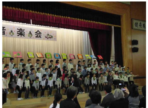
【音楽会より 3年生のボディパーカッション】

この音楽会での成長を契機に、残り1ヵ月の2学期をより有意義な学びの時間にして欲しいと思います。ご家庭でも励まして下さるようお願いいたします。