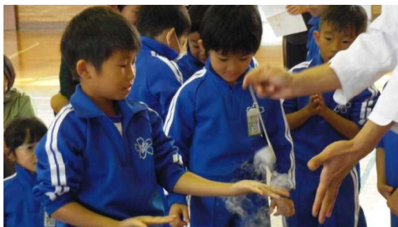
【↑ 2年生の液体窒素を使った実験です。】

3 学年親子学習会は運動会さながらの真剣勝負で「親子運動会」に汗を流しました。子どもたちも保護者の皆さまと一緒にとても楽しい時間を過ごすことができました。親子学習会を計画、準備していただいた皆さま、ご多用の中、親子学習会に参加していただいた皆さま、本当にありがとうございました。