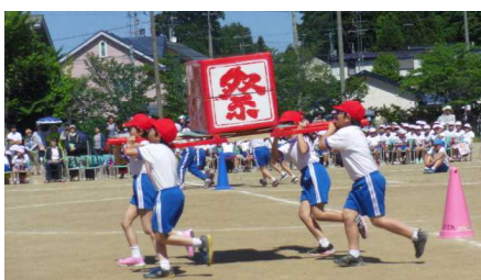
5年「おみこしワッショイ！」