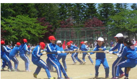
4年「走れ！つかめ！うばいとれ！」