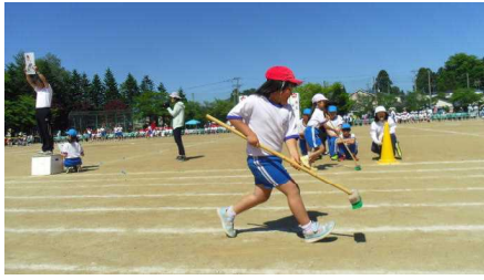
2年「フレバックピョンチャンオリンピック」