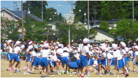
1年「ダンシング玉入れ」