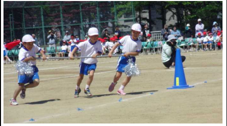
3年「長者ハリケーン」