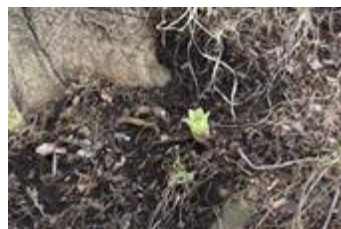
八小の森にもふきのとうが芽吹いてきました。春です。