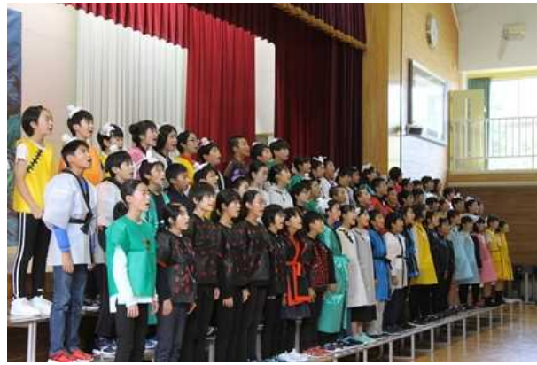
最後を締めくくった感動的な6年生の合唱

十月十三日の学習発表会は穏やかな天候に恵まれ、たくさんのお保護者や御来賓の皆様にご来校いただきました。数日前に行われた校内学習発表会では、他の学年の発表を拍手や拍手をしながら、一体となって本当に楽しそうに見ていました。そこで手ごたえを感じた子どもたちは、土曜日の発表会では、さらに自信をもって表現しているようでした。また、保護者や地域の皆様の温かい拍手や声援の後押しで、より一層張り切ったようです。友達や家族などに認められることで、子どもは自信をもって精一杯取り組みます。今後も、御支援、御協力をお願いします。