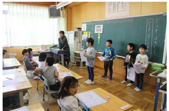
参観授業での子どもたち

四月二十日、今年度第一回目の参観日を行いました。約九割の保護者の方が授業参観に来てくださいました。ありがとうございます。特に一年生の保護者の皆様は、初めてお子様の学習の様子を見て、どのような感想を持たれたでしょうか。慣れない小学校生活で、さらにたくさんさんの保護者の皆様に見ていただいて、子どもたちも緊張したり、気持ちが高ぶったりして、普段とは様子が違う部分もあったのではないかと思います。他の学年でも、進級の喜びと不安、担任がかわったことでの気持ちの変化などもある子どもも多数いる