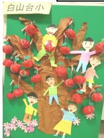
おいしいそうなリンゴの木

ました。共同で取り組んだ大きな作品も数点あり、来場者の目を引いていました。二月二日(土)、三日(日)の二日間は、市内小学校の図画工作展が、福祉公民館で開催されます。本校児童の作品も展示されますので、時間に都合のつく方は、是非御覧ください。