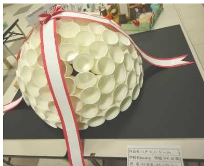
紙コップを使ったスノードーム

白山台地区の子どもたちの九年間の学びと成長の連続性に配慮して、今後も三校が連携して取り組んでいきたいと思っています。