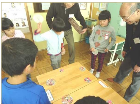
めんこを覚えてもらう子どもたち

のボランティアの方々には教えていただきました。一月二十九日からは、四年生が学級ごとに豆しとき作りに挑戦しました。三日間、延べ二十七名のボランティアの方々に来ていただきました。二月一日からは、三年生がきなこ白玉だんごづくりに取り組みます。三日間延べ三十七名のボランティアの方々にお手伝いしていただきます。