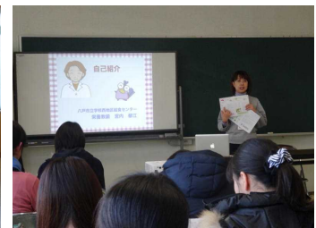
1年生親子レクリエーション(1/30)