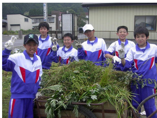
▲1学年：リヤカーいっぱいの雑草