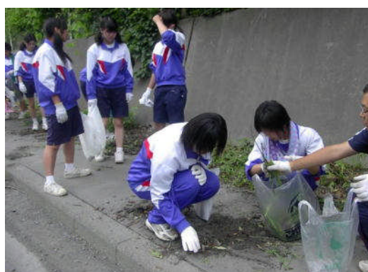
▲3学年：通学路の草取りとゴミ拾い