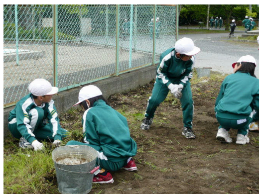
プール周りの草取りをする4年生