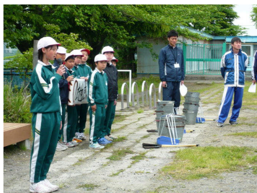
はじめの会で説明する計画委員