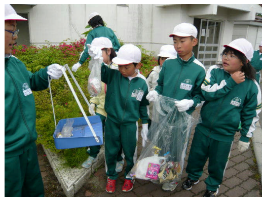
団地の公園と周辺のごみ拾いをする2年生，5年生