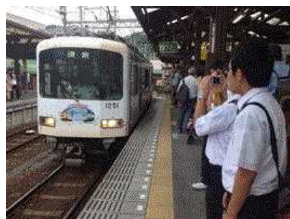
鎌倉自主研修江ノ電に乗って。