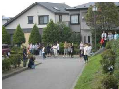
保護者の方のお迎えです。