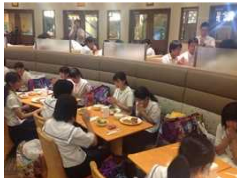
ホテルで夕食をとりました。

ディズニーランド終了後、ホテル舞浜ユーラシアに到着し、遅めの夕食をとりました。宿泊も最後となり、お土産もたくさん買い込み、楽しいひとときを過ごすことができました。