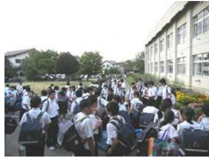
修学旅行団、解散です