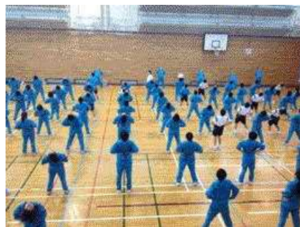
2日目朝、ラジオ胎動です。