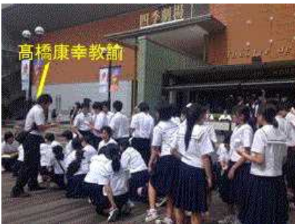
四季劇場前でチケット配付

昼食後、劇団四季ミュージカル「ライオンキング」を観劇しました。生徒のほとんどが初めて生のミュージカルを見たようで、この旅行で最高に感激したとっていました。修学旅行の大きな意義の一つに八戸で日常、見ることができないものに触れることがあると思います。この旅行で得た感動は、生涯忘れないものになり、進路を考える上で大きな参考になってくれることを期待しています。