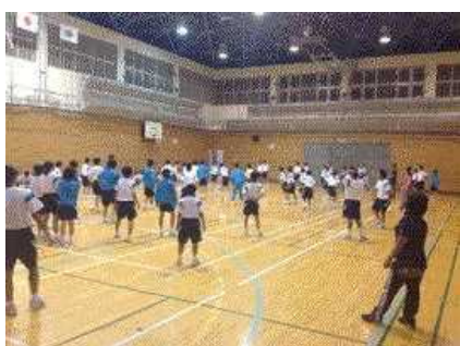
夜レクのドッジボール大会。