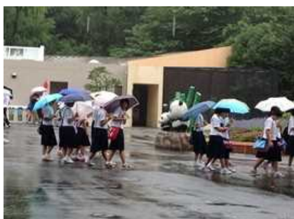
上野動物園を見学。

9月7日（日）修学旅行最終日となりました。朝8：30ホテルを出発し、上野公園内の動物園、国立博物館、西洋美術館、科学博物館などを見学しました。この日は朝から小雨でしたが、公園内の施設を各班ごとの計画に沿い見学することができました。