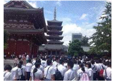
浅草寺に集合しました。

昼食後、劇団四季ミュージカル「ライオンキング」を観劇しました。生徒のほとんどが初めて生のミュージカルを見たようで、この旅行で最高に感激したとっていました。修学旅行の大きな意義の一つに八戸で日常、見ることができないものに触れることがあると思います。この旅行で得た感動は、生涯忘れないものになり、進路を考える上で大きな参考になってくれることを期待しています。