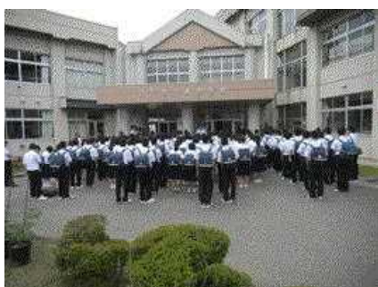
朝、出発式を行いました。