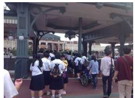
夢の国へ行ってきます。