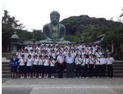
鎌倉大仏前で記念写真。