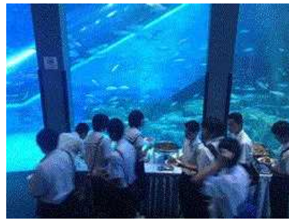
大水槽前のレストランで夕食