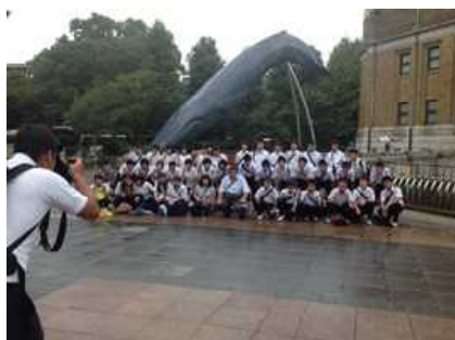
科学博物館前で記念撮影。