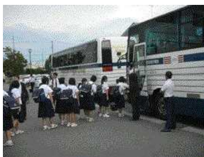
バス乗車後、東中学校出発、最高に楽しい時間です！