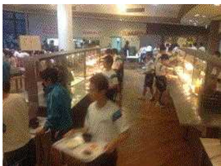
夕暮れの岩手山をのぞみながらの素敵な夕食でした。

9月1日(月)・2日(火)の1泊2日の日程で、1学年生徒全員で宿泊学習を行いました。1日目は朝6:30集合、7:00に学校から岩手県滝沢市にある岩手山青少年交流の家に出発しました。交流の家では、野外炊事(1日目昼食、カレーライスづくり)、あけびつるクラフト製作、夜の勉強会、オリエンテーリング(2日目)などを体験しました。