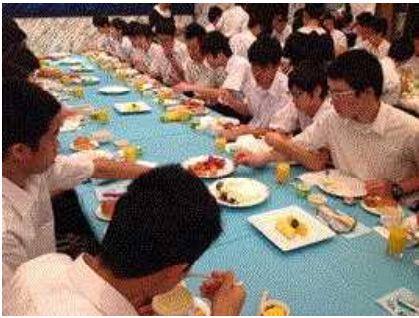
ホテルでの朝食です。

9月5日（金）、朝8：00ホテルをバスで出発し、東京スカイツリーを見学しました。この後、班ごとに電車を利用したり、徒歩で浅草寺へ移動します。子どもたちは、仲見世通りでの買い物や食べ歩きを楽しみました。