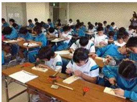
あけびつるクラフトです。