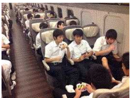
新幹線に全員乗車できました。

八戸駅10:16発はやぶさ14号に全員が無事乗車し、東京駅に13:20無事に到着しました。車中では昼食の弁当が配られ、おいしくいただきました。東京駅から鎌倉市長谷の高徳院に到着し、境内にある本尊「鎌倉大仏」「長谷の大仏」として知られる阿弥陀如来像（国宝）を見学しました。この後は、鎌倉自主見学が行われました。