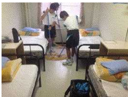
2日目朝、起床後の清掃