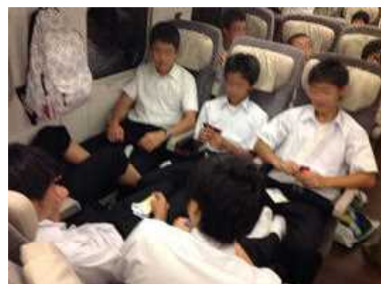
新幹線乗車、八戸に帰れます

上野駅13：26発のはやぶさ21号に全員、無事乗車しました。乗車後、昼食の弁当が配付され、修学旅行最後の食事となりました。こんばんは久しぶりに自宅で夕飯がとれます。16：13八戸駅に到着し、東中到着17：00、帰校式後17：40ごろを解散し、修学旅行全日程を無事終了することができました。