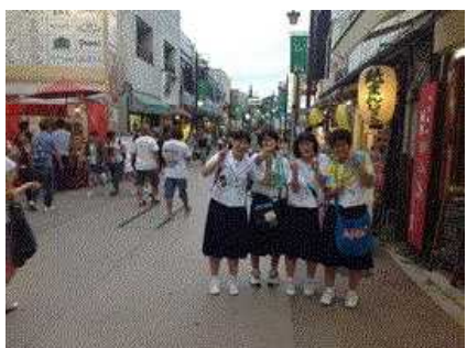
鎌倉小町通りでお買い物