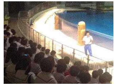
イルカショーを観ました。