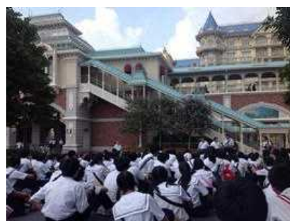
舞浜駅に全員到着しました。