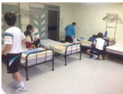
きれいな部屋です。