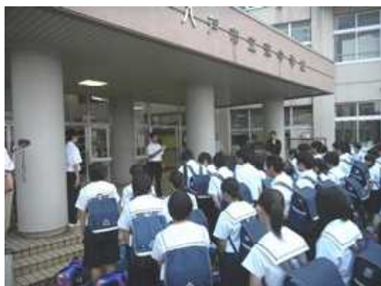
昇降口前で帰校式。

上野駅13：26発のはやぶさ21号に全員、無事乗車しました。乗車後、昼食の弁当が配付され、修学旅行最後の食事となりました。こんばんは久しぶりに自宅で夕飯がとれます。16：13八戸駅に到着し、東中到着17：00、帰校式後17：40ごろを解散し、修学旅行全日程を無事終了することができました。