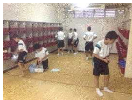
お風呂の脱衣所です。

9月1日(月)・2日(火)の1泊2日の日程で、1学年生徒全員で宿泊学習を行いました。1日目は朝6:30集合、7:00に学校から岩手県滝沢市にある岩手山青少年交流の家に出発しました。交流の家では、野外炊事(1日目昼食、カレーライスづくり)、あけびつるクラフト製作、夜の勉強会、オリエンテーリング(2日目)などを体験しました。