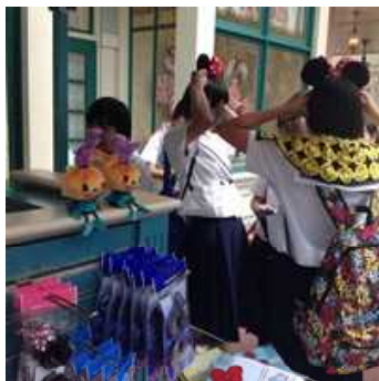
ディズニーランドお買い物、昼食、アトラクション