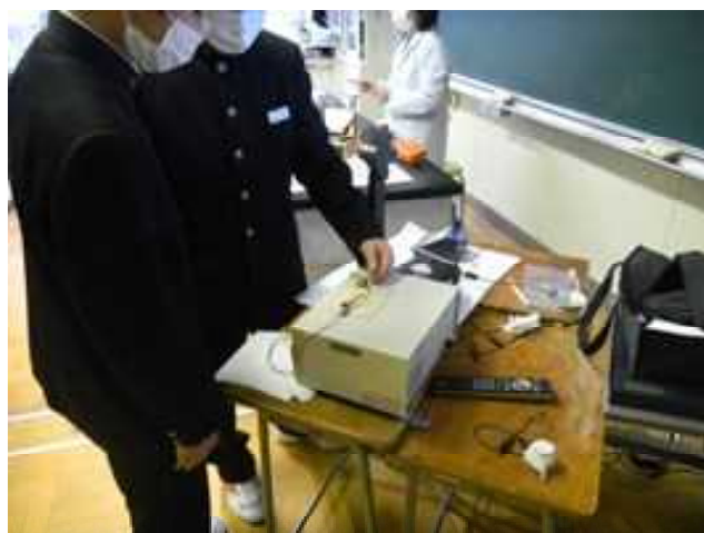
フレミングの左手の法則 モーター回るか？