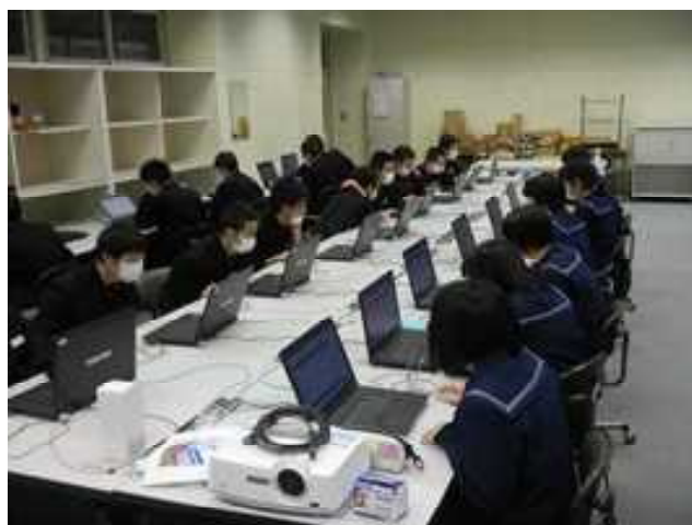
2年生技術 パソコンでグラフィック