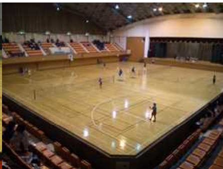
女子インドアテニス大会