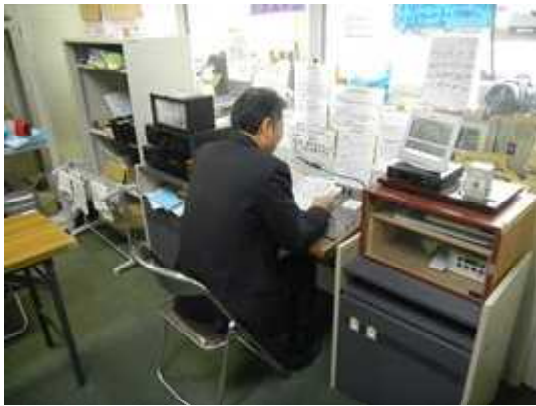
放送室から式辞を読み上げる校長先生