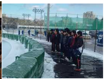
陸上部がスケート大会応援