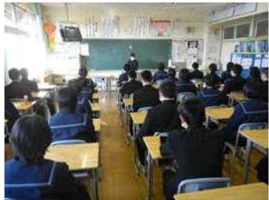
教室で放送による始業式を聞く生徒たち

1月14日(水)3学期始業式を行いました。初日よりインフルエンザ罹患者が6名という状況でしたので、インフルエンザ蔓延防止のため放送による始業式としました。