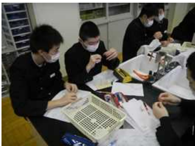
2年生理科の実験 手作りモーターの製作