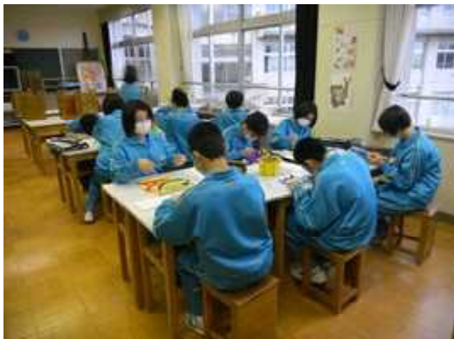
1年生美術の授業 美術室

1月27日（火）インフルエンザの大きな拡大も見られず、全校生徒マスク装着で授業を受けています。手洗い、空気の入替えなども指導しています。