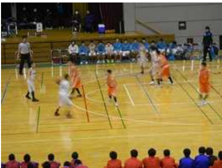
男子バスケット決勝戦