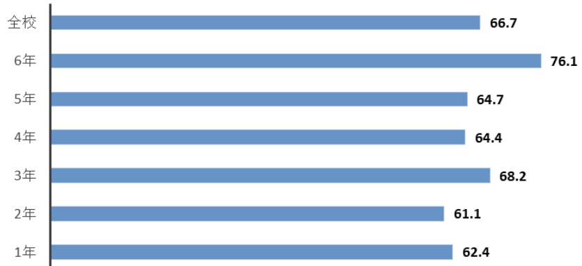
夏休みの一人平均歯みがき回数

夏休みの歯みがきの様子を歯みがきカレンダーからまとめてみました。夏休みは33日間でしたので、朝夕の1日2回やると、66回になります。カレンダーの○の数を集計し、一人平均の回数を出したところ、全校では66.7回となり、目標を達成することができました。学年ごとを見てみると66回に達していない学年が見られ、平均76.1回だった6年生によって、平均がぐっと上がったことがわかります。どの学年も1日2回が達成できるようにと思います。