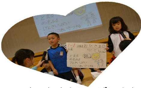
↑ 1年生もりっばに発表!