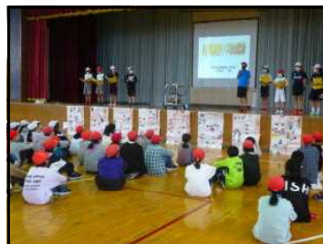
八戸市と本校の紹介