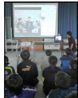
事前のオンライン