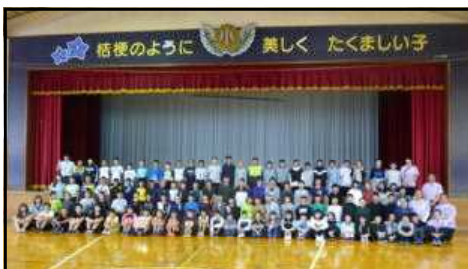
全体写真「かに！」のかけ声で撮影

10月1日(木)の交流会に向けて、事前にオンライン通話でお互いの自己紹介や情報交換を行いました。これで子供たちのモチベーションもぐんと上昇し、交流会に向けての準備も計画的に進んで、いよいよ本番の日を迎えました。交流会では、弘前ねぶたのお囃子を聞いたり、お互いの校歌を聞き合ったり、鬼ごっこやじゃんけん大会で大盛り上がりの学習活動が行われました。途中、弘前の皆さんに「桔梗野小学校の皆さん立ってください。」と呼びかけたつもりが、なぜか全員立ってしまうなど、何ともほほえましい連帯感が最高でした。次はぜひこちらからも尋ねてみたいと感想をもつ子供たちが多く、実り多い学習となりました。弘前の桔梗小の皆さんは、この後、八食センターや種差海岸に向けて出発しました。