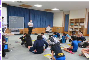
6年: 桔梗野の歴史を調べよう

いよいよ学習活動も軌道に乗り、課題解決のために地域のゲストティーチャーをお呼びしての学習をしています。今後も子供たちのためにお力をお貸しいただけると幸いです。