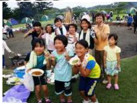
「思い出の合同キャンプ」

この夏休み、子ども会活動や合同キャンプ、三社大祭など、子どもたちは地域の活動に積極的に参加する姿がありました。特に合同キャンプは昨年よりも参加児童が増え24名の参加となりました。これもひとえに保護者の皆様のご理解の賜です。地域の多様な活動への参加によって、学校や家庭では体験できない学びがあり子どもたちの成長のエネルギーになります。