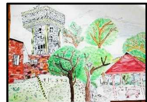
6年 大村 さくら