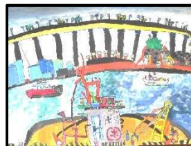
4年 岩淵 悠真