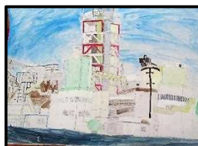
5年 三浦 大雅