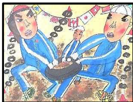
3年 関下 春輝