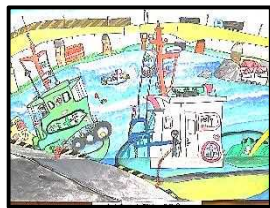
4年 番澤 咲友