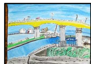
6年 杉若 楽良