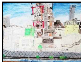
5年 工藤 結葉