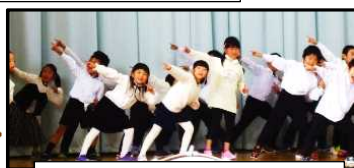
1年「かがやけ いのち」