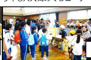
今年も大人気のくじコーナー