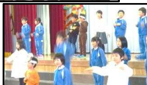
2年「どうぶつ園のじゅうい」