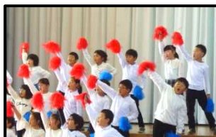
3年「レッツゴーいいことあるさ」