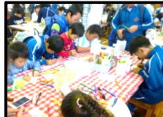
ちぢみっこコーナー