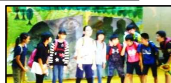
6年「少年少女冒険隊」