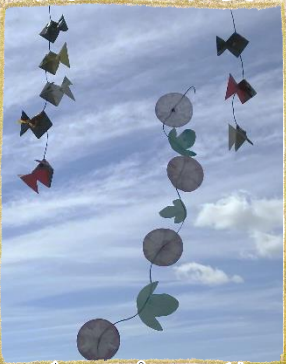
～ディスプレイ・秋～