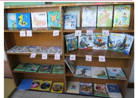
どんな本があるかスグ分かる！

さらに、今年度は八戸市の図書館司書さんが来てくださっています。司書さんいろいろなと指導していただき、図書室を使いやすく整備中です。たとえば、①古くなった事典などの資料の廃棄、②図書番号の整理、本が置いてあるかをわかりやすいように工夫し、ディスプレイするなどです。