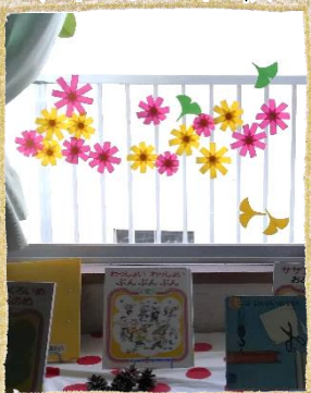
～季節のおすすめ本～