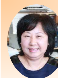
特別支援アシスタント

はじめまして。この度町畑小学校にお世話になることになりました。前の職業を生かし、子ども達が安全に過ごせるように校舎内外の施設を点検・整備し、誠意をもって対応したいと思っています。どうぞよろしくお願いいたします。