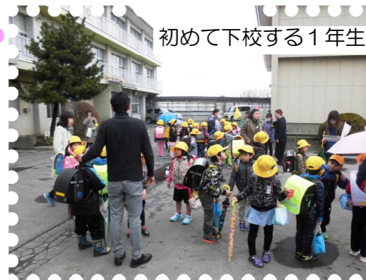
初めて下校する1年生

地域の皆様、危ないと思った行動などが見られたときは、1年生に限らず声をかけてくださるとありがたいです。