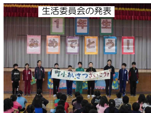
生活委員会の発表

毎週水曜日の朝に行っている「全校朝会」「音楽朝会」に加えて、今年度は「児童朝会」を加えました。年間8回を予定しています。これは、児童会をもっと意識させて、子ども達の自主性や自治性を育てたいという考えからです。特に5・6年生の子ども達には、自分たちが町畑小学校のよき伝統を受け継いで、「さらによくするんだ！楽しくするんだ！」という気概をもってほしいと思っています。