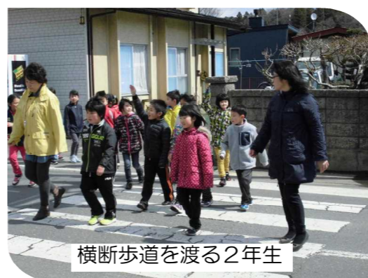
横断歩道を渡る2年生

4月11日(月)、1・2年生が年度はじめの交通安全教室を行いました。白銀交番、交通安全協会町畑支部・交通指導隊の方々や交通安全母の会の皆さんの協力を得て、実際に道路を歩きながら、正しい道路の歩き方や横断歩道の渡り方を学びました。