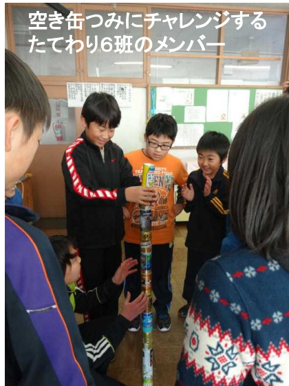
空き缶つみにチャレンジするたてわり6班のメンバー