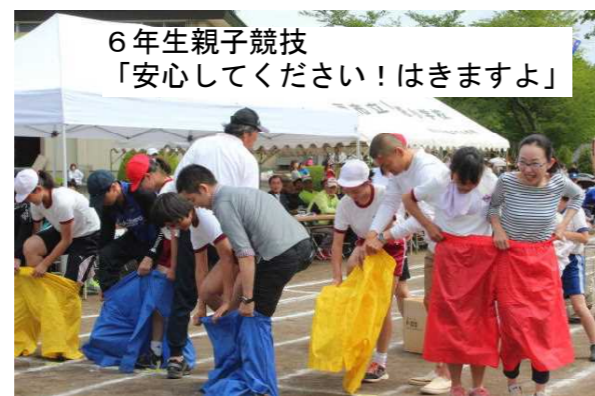
6年生親子競技「安心してください!はきますよ」