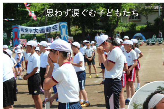
思わず涙ぐむ子どもたち

4年生以上の子どもたちは、自分の競技以外に応援団や係の仕事を組織して、ほんとうによく働きよく