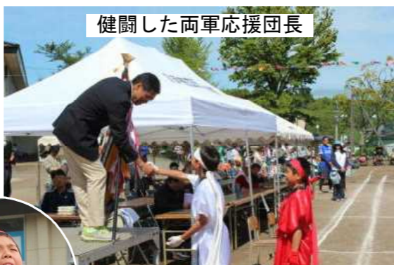
健闘した両軍応援団長

がんばりました。2週間の一生懸命な練習、本番の活躍、僅差の勝負とほんとうに感動の運動会となりました。