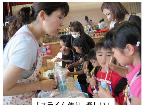
「スライム作り、楽しい」