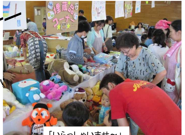
「いらっしやいませ～」

スタートと同時に 一番混む 埋蔵品コーナー！ 掘り出し物 たくさんありましたね！