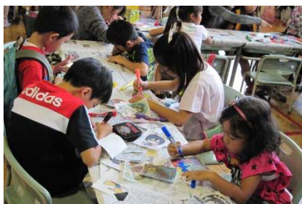
「自分だけのプラ板、作りました」