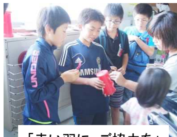
「赤い羽に ご協力を」