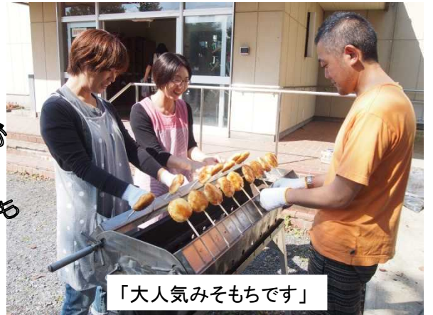
「大人気みそもちです」

人気のみそもち! 1本1本ていねいに焼き上げ 愛情いっぱい。 町小にサーティーワンアイスが やってきた! 大行列にサーティーワンアイスが 大忙し!