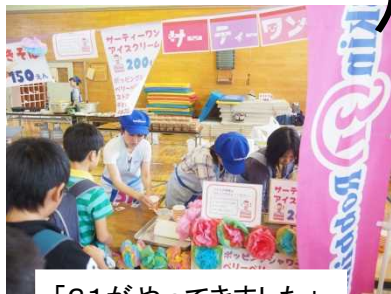
「31がやってきました」