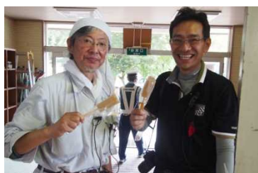
「味付けコンニャクしみてます」