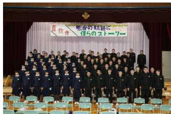
チーム明治 全校合唱「虹色の未来」

10月15日(日)、「真・信・伸」～明治の軌跡に紡ぐ僕らのストーリー～のテーマのもと、明中祭が開催されました。1年生にとって、初めての明中祭。2年生にとって、昨年以上の明中祭をとの想い。3年生にとって、三年間の集大成、また中学校生活最後の明中祭でした。短い期間でしたが、各学年それぞれの想いを胸に、準備活動を進めました。合唱発表会、吹奏楽部発表、各学年発表1学年(「ブラ○モリ in ハウ」)、2学年「劇団チキン 秋公演『G JWからEMB』」、3学年ダンス「MEIJIC STATION super live 2017」、演劇「学校童子」その他に、英語スピーチ・国語弁論・海外派遣報告とたくさんの発表をさせていただきました。お陰様で、実行委員会中心に、全校生徒78名で、今回のテーマでもある、「明治の軌跡に紡ぐ僕らのストーリー」を完結させました。お忙しい中、多くの皆様方にご来校していただきました。本当にありがとうございました。