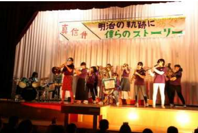
吹奏楽部3年生、最後のステージ！！