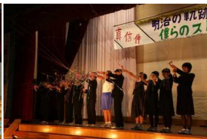
新旧生徒会役員交代。ご苦労様でした！