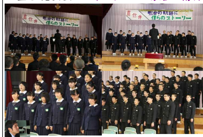
素晴らしい合唱！感極まり思わず涙・・・