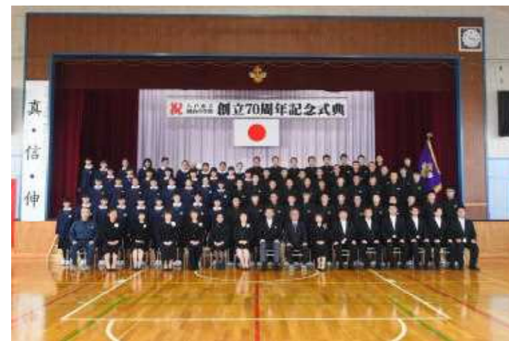
（チーム明治 全校生徒・教職員）