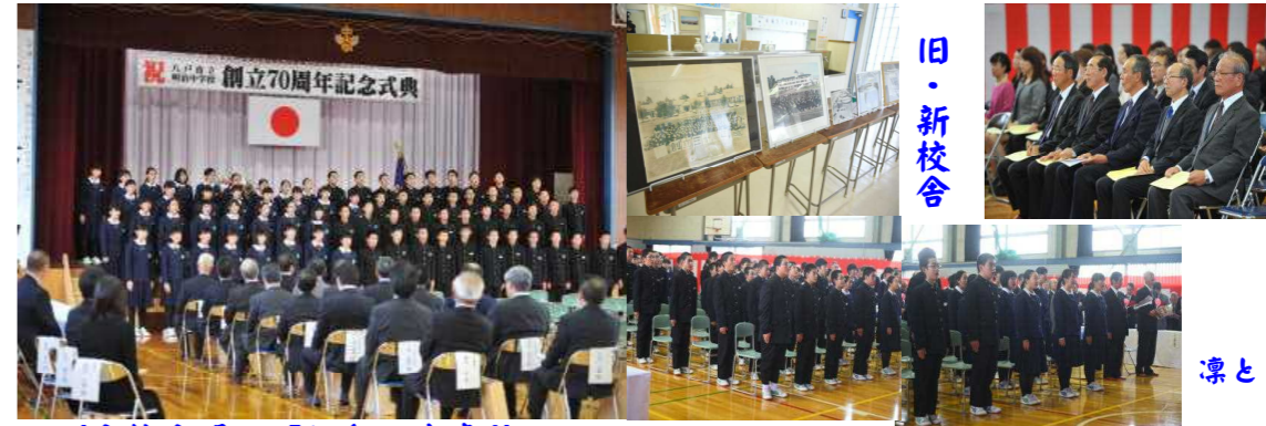
（全校合唱 「虹色の未来」）

70年の歴史は、かけがえのない刻の連なりです。これまで物心両面にわたってご支援・ご協力を賜りました保護者、同窓生、地域の方々を中心に感謝申し上げますとともに、生徒たちがこの地に生まれてこの地に育つことに喜びを感じ誇りをもって生き、新たな軌跡を創り出せるよう、教職員一丸となって頑張っております。皆様には、今後とも本校の教育活動にお力添え下さいませようお願い申し上げます。（記念誌より一部抜粋）