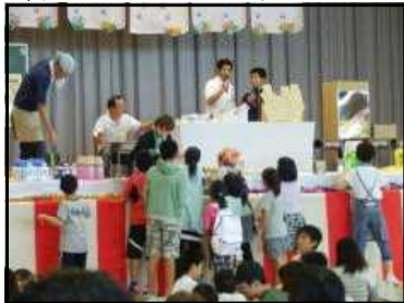
福引きの抽選会は今年も大盛況

9月10日（日）には保護者の皆さんが団結したPTAバザーが開催されました。例年より早い開催で保護者の皆様には大変御苦勞をおかけしました。おかげさまで、子どもたちは「おいしく、楽しい一日」を過ごすことができました。また、子どもも世話人の皆さんには「チャレンジ・ランキングコーナー」も設置していただき、子どもが真剣な顔で挑戦している姿を見ることができました。来年度も保護者や地域の方々の交流が深まるPTA行事になることを期待しています。