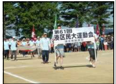
約 670 名の参加者があった入場行進。 子どもも見えました。

今年度の学校の重点施策の一つに「町内の行事に参加する」があります。その効果なのか昨年度よりも小学生の参加が多かったことにホットしました。区民運動会後の校長講話では「湊の運動会は市内1番です。」「湊は人と人が交流する温かい所です。」と話しました。これからも、地域行事への参加を促してまいりますので、子どもたちの様子を学校へ伝えていただけると幸いです。