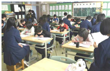
1/9 西高生との寺子屋学習