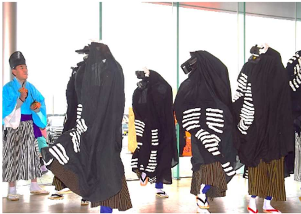
地域の方のお囃子で元気に舞う神楽クラブ