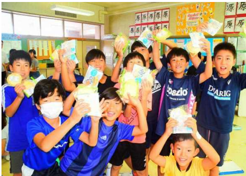
南部せんべいの秘密

5年生が1泊2日で種差少年自然の家へ宿泊学習に行ってきました。晴天に恵まれ、いかだ遊び、焼き板クラフト作りの全日程を予定どおりに行いました。「考動」をめあてに葉を見ながら、自分たちで考え行動しました。どの活動も全力で楽しみ、笑顔いっぱいの2日間でした。