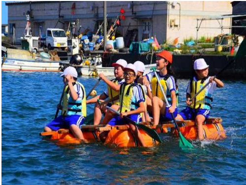
楽しかった宿泊学習

5年生が1泊2日で種差少年自然の家へ宿泊学習に行ってきました。晴天に恵まれ、いかだ遊び、焼き板クラフト作りの全日程を予定どおりに行いました。「考動」をめあてに葉を見ながら、自分たちで考え行動しました。どの活動も全力で楽しみ、笑顔いっぱいの2日間でした。