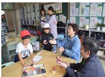
▲低学年 三世代交流学習

6月17日、1・2年生が三世代交流学習「昔の遊び」を実施しました。たくさんの祖父母の皆様やボランティアの皆様、保護者の皆さんと一緒に楽しい時間を過ごすことができました。こま回し、けん玉、お手玉などを、熱心に教えていただきました。