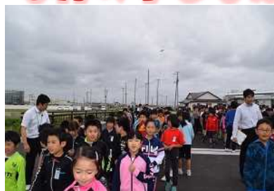
▲「三條未来橋」渡り初め

6月11日、新しく完成した「三條未来橋」の渡り初め式に全校で参加しました。なかなかできない体験に子どもたちは大興奮！ドローンでの撮影にも興味津々でした。橋の上で撮っていただいた全校写真が学校に飾ってありますので、どうぞ御覧ください。