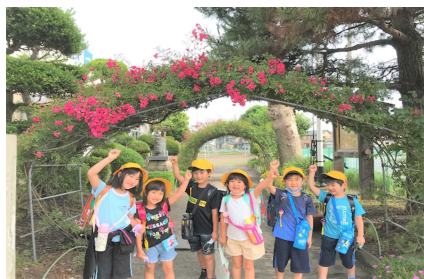
＜朝の元気な子どもたち＞

八戸市立三條小学校 令和2年度学校だより 第10号 令和2年7月22日 ☎ 27-2216