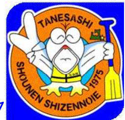
種差少年自然の家 マスコットキャラクターたね坊

「今年度は、コロナ対応から、日帰り体験学習という形で実施する学校が多くありましたが、予定通りの利用をしてもらいありがたいです。三条小の子どもたちを見てみると、進んで自分たちでやろうとしますし、先生方も求められるまで助言や手助けをせず見守っています。たくましいなあと思いました。失敗しないようにと手厚くサポートする学校が多い中で新鮮な光景でした。男女の協力もよかったですし、何よりも、三条小の子どもたちの挨拶と返事がとても元気があり、気持ちのよい二日間でした。」