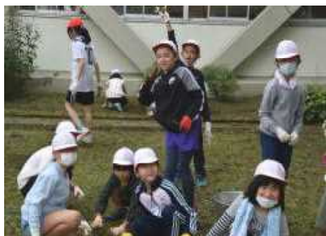
クリーン作戦 (9月24日)

3~6学年が参加し、日常生活で簡単にできるトレーニング方法を実技も交えて分かりやすく教えていただきました。教えてもらったことを意識して正しい姿勢を保持できるように頑張らせたいと思います。