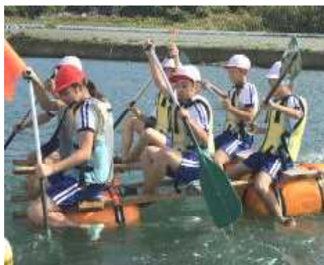
5年宿泊学習 (9月17日・18日)

縦割班で協力して働くことをめあてに、約1時間にわたって、校地内の草取りをしました。どの学年の子どもたちも頑張って目標を達成し、学校もきれいになりました。これで、気持ちよく運動会を迎えられそうです。