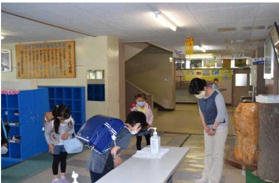
元気なあいさつをめざして

休み時間になると、笑顔で楽しそうに遊ぶ子どもたちの姿がたくさんあります。その中には、先生方も交じって汗を流し遊んでいますよ。元気いっぱいな三条っ子たちです。