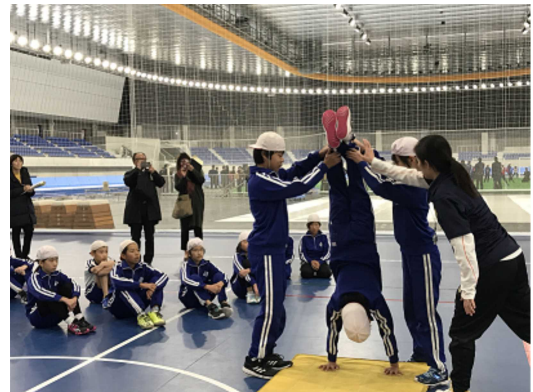
<YSアリーナでの授業風景>

これからいよいよ学期末のまとめの時期になりますが、子どもたちがともに学ぶことの楽しさや喜びを分かち合いながら、心豊かに学び合う授業づくりに努めていきたいと思えます。