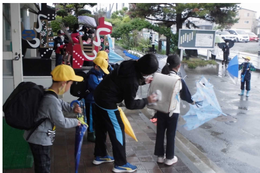
雨の日に高学年のお兄さんお姉さんがやってくれる後輩たちのランドセル拭き

心の教育だけでなく、勉強も、運動も、全ては、この「 A 当たり前」のことを B 馬鹿にしないで、 C ちゃんとやる D ことで、できるようになり、夢をかなえ、なりたい自分になることができるものと考えています。今年度私たちは、この頭文字のアルファベットを取って「ABCD教育」と呼んで指導しています。私も自分自身の夢に向かってABCDに取り組んでいます。皆さんもやってみませんか。