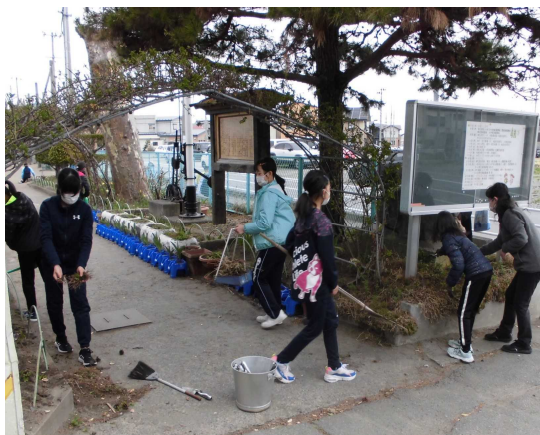
毎朝子供たちと先生方でやってくださっている自主的な花壇・玄関の清掃

6月25日の昼の放送で、橋本教頭先生から「今日も欠席がゼロでした。今年度もう4日目です!」。全校の子供たちも先生方も大喜びでした。全員が登校しているということは、「当たり前」のことのようですが、実現するのは大変に難しいことです。全員が登校できるということは、358人一人一人が健康な状況であるということです。ぜひこれからも一人一人の子供、保護者、教職員が健康に気を付け、このような素敵なお日がたくさん実現できるように力を合わせてまいりましょう。「学校は人間がよくなる場所」です。健康なときにはぜひ学校に来てほしい。校門をくぐれば必ず成長します。学校とはそういう場所です。