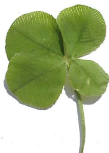
3年生の男の子がくれた宝物 四つ葉のクローバー