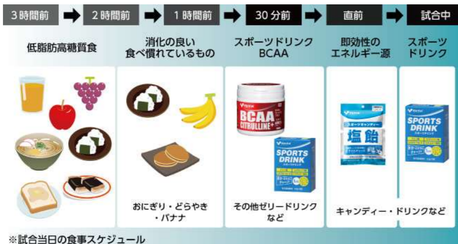
※試合当日の食事スケジュール

基本は前日と同様です。エネルギー源である脂質を中心としたメニューとし、消化がよいものを選ぶようにしましょう。できれば、試合が始まる3時間前までには食事を終えている状態にするのがポイントです。また、時間が無い場合、最低限、糖質とビタミンミネラルは摂るようにし、試合後にたんぱく質や残りの糖質を補給するイメージになります。参考にしてください。