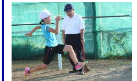
新しくなった砂に向かってロングジャンプ