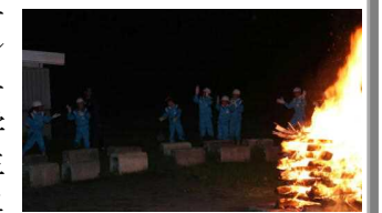
炎をまわりでフォークダンス