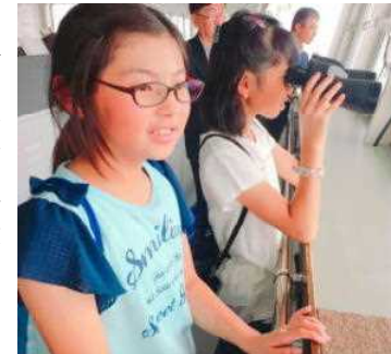
フェリーにて「いるか見えるかな?」

6月27日から3日間、6年生が北海道に修学旅行に行ってきました。雨模様の天気でしたが、自主見学のときは雨がやみ、昭和新山での記念写真では霧が消えました。普段の行いがいいので、ここぞのときに天気も応援してくれて、思い出いっぱいの旅行になりました。