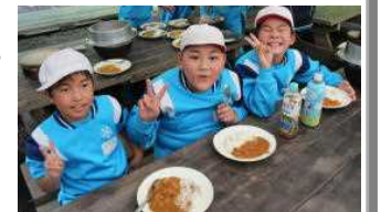
カレーライスおいしくできたぞ

7月12日から2日間、4、5年生が県北青少年の家(二戸市)に行ってきました。野外炊飯やネイチャーゲーム、キャンプファイヤー等、学校では学べない自然を生かした体験をたくさんしてきました。仲間と助け合いきびきびと活動する姿は大変立派でした。