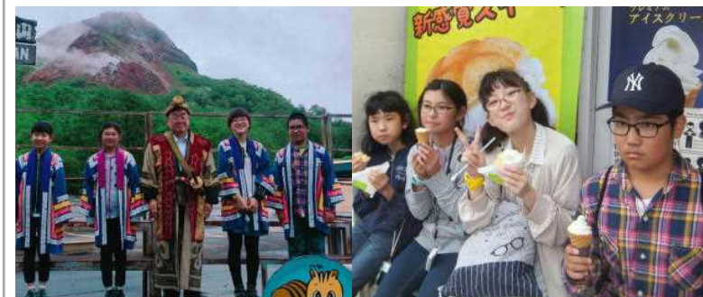
一瞬視界が開けた昭和新山