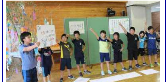
七夕クイズを出す元気いっぱいの4、5年生