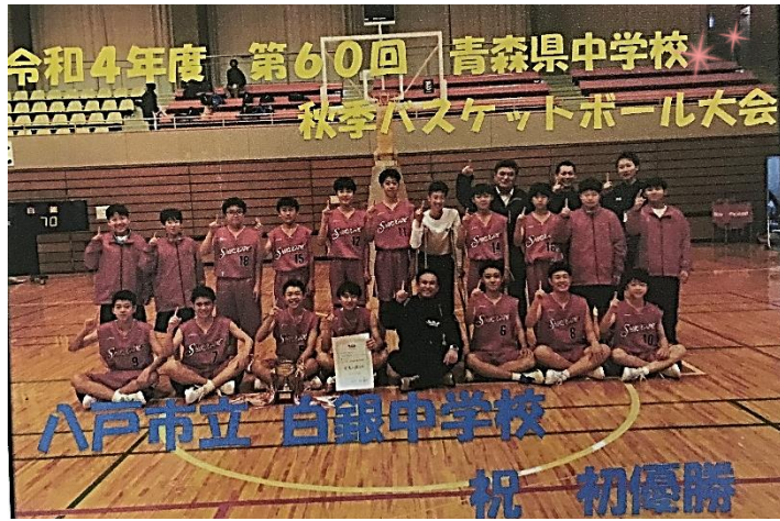
白銀中創立75年目の快挙！ 喜びに沸く部員、〇〇コーチ、〇〇・〇〇両顧問の笑顔

試合中はメンバーとコミュニケーションをとって臨めたことや、個々が得意なプレーを発揮し力を出し切れたことが勝利につながった。ここがゴールではなく、夏に向けて足りないところを直していきたい。学校の先生方やコーチ、保護者そして大会を運営してくれた生徒や先生方に感謝したい。ありがとうございました。(部長 〇〇〇〇〇)