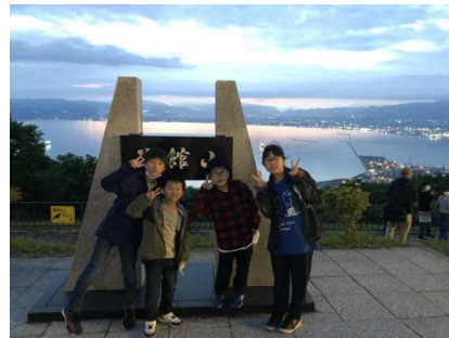
雨上がりの夜景がきれいでした