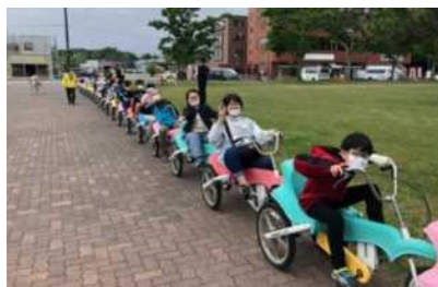
クラス全員がつながった自転車