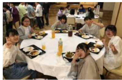
円卓を囲んで中華バイキング