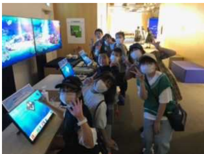
自主研でのキラリスも人気でした