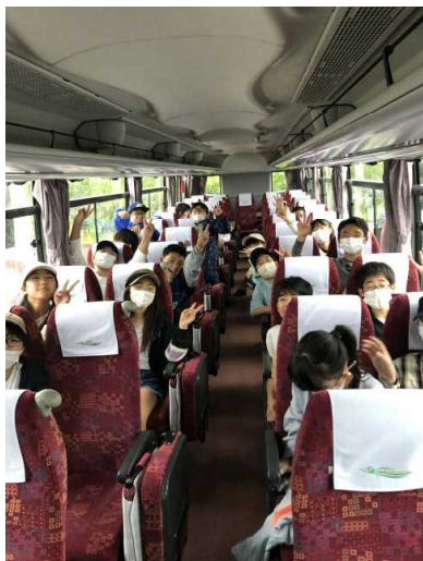
バスの中も楽しい時間