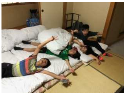
楽しみな部屋の時間