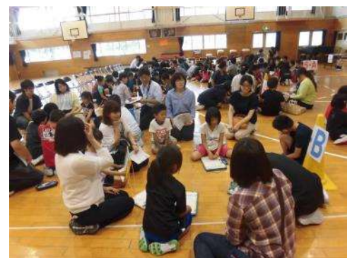
親子でのめあての話し合い

明日から始まる夏休みに、家庭で過ごす子どもたちの姿勢に目を向けてくださるとうれしい限りです。今年も、『 挑戦(チャレンジ) 』をキーワードに 実り多き夏休み になってくれることを願っています。8月22日(水)の2学期始業式にたくましく成長した子どもたちに会えることを楽しみにしています。