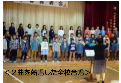
<2曲を熱唱した全校合唱>

子どもたちは、歌うことが大好き、演技することが大好き、表現することが大好きです。そして何よりも、見ていただいた方を感動させ、認めてもらうことで持てる力を十分に発揮します。58名の全校合唱をスタートに、児童館の園児さんによる遊戯、そして、豊崎小児童がステージいっぱいに繰り広げる身体運動や迫真迫る演技、美しい歌声や器楽演奏と、まさに、子どもたち一人一人の持ち味が活かされ、『一人一人が主役』で大熱演の学習発表会となりました。