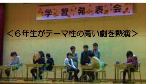
<6年生がテーマ性の高い劇を熱演>

一生懸命に発表する子どもたちの姿に、胸が熱くなる思いでした。子どもたちと先生方が目標を決め、見に来ていただいた方々に喜んでもらおうと一体となって練習や準備をしてきた成果だと思います。5年生以上は、進行係、ステージ係、照明係、会場係など自分の出番以外にも仕事を頑張り、学校行事をリードしてくれたことに頼もしさを感じました。