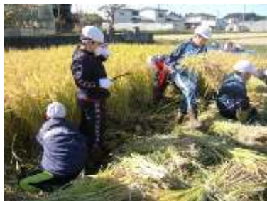
10/17 5年生 稲刈り

夏の天候不良で、成長が心配されたお米と野菜でしたが、今年もしっかり実りました。特にサツマイモは、昨年以上の大豊作とのこと。今年も焼いもにして、おいしくいただきました。