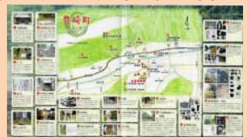
<豊崎の歴史・文化再発見マップ>

そして、これまでの『豊崎郷土かるた』に、豊崎ならではの歴史に関する言葉、例えば、「咽平遺跡」「唸り石」「七崎屋半兵衛」「役屋跡」「滝谷天満宮」などの言葉を盛り込めたらと考えています。そして、かるたが完成しましたら、昨年度『種差景観かるた』を完成させた種差小学校の児童とそれぞれの地域の自慢を、かるたを通して交流できたら、なんと素敵なことだろうと思いをふくらませています。お楽しみに！