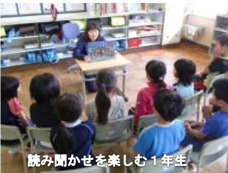
読み聞かせを楽しむ1年生

本校では、年3回の読書週間を設定し、読書の楽しさと喜びを味わわせるために、様々な取り組みを行っています。まず、『本は友だち』一人一冊運動です。いつもそばに読みかけの本を置き、すぐ手に取って読む環境を作っています。そして、子どもたちが一番好きなのが、『読み聞かせ』の時間です。担任のお気に入りの一冊、図書委員会による大型絵本の読み聞かせでは、「もっと聞きたい。」と話す子もいるほどです。最後は、『心をつなぐ親子読書』運動です。1冊の本を親子で読み合っその感想を交流する