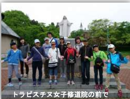
トラピスチヌ女子修道院の前で

5月31日(水) 6年生が函館に2泊3日で修学旅行に行きました。インフルエンザの猛威にもかかわらず、全員参加で体調を崩すこともなく、全日程を笑顔と感動で制覇し、たくさんの思い出を作りました。特に、新函館北斗駅と函館駅とを結ぶ函館ライナーを初めて利用し快適な列車の旅を堪能しました。初めて目にする函館の自然、歴史、人情にふれ、感動しきりの9名たち。出会った方々にさわやかな挨拶をし、友情を深めた3日間となりました。