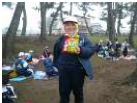
実写版「カールおじさん」