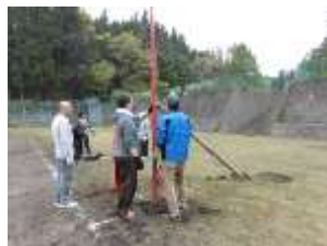
入場門の取り付け