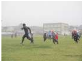
子どもには負けません！