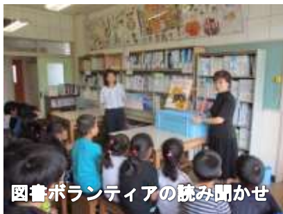
図書ボランティアの読み聞かせ

本校では、年3回の読書週間を設定し、読書の楽しさと喜びを味わわせるために、様々な取り組みを行っています。まず、『 本は友だち 』一人一冊運動です。いつもそばに読みかけの本を置き、すぐ手に取って読む環境を作っています。そして、子どもたちが一番好きなのが、『 読み聞かせ 』の時間です。担任のお気に入りの一冊、図書委員会による大型絵本の読み聞かせでは、「もっと聞きたい。」と話す子どもいるほどです。最後は、『 心をつなぐ親子読書 』運動です。1冊