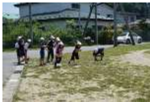
見事なスタートダッシュ!

6月19日(火)に新体力テストを行いました。学年でまとまっているいろいろな種目に挑戦しました。子どもたちは昨年の記録を覚えていて、記録が伸びたことをとても喜んでいました。6年生は、測定の仕方を知りやすく下級生たちに教えてくれました。そして、5年生以下が終わってから、自分たちの測定、後片付けと裏方としてもがんばってくれました。