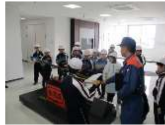
手動のポンプにびっくり