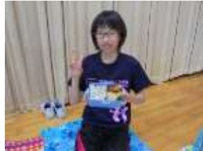
さすが6年生、自作です。