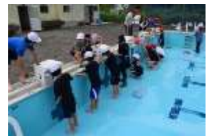
一生懸命働きました

6月21日(木)に6年生が瑞豊館のプール清掃をしました。たわしでこすると、汚れがどんどん落ちてきれいな水色の側面が現れました。保護者の皆様には夏休み中のプール監視をお願いしております。子どもたちが安全に楽しめるようご協力お願いいたします。