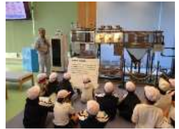
豊崎の水もここから