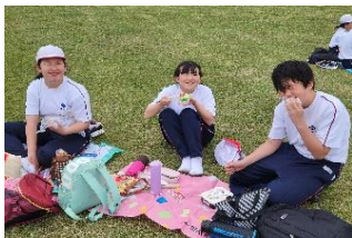
おうちの人に感謝!

帰校する前に、種差海岸に向かって感謝の言葉を全員で述べたり、おやつのごみなどが一つも落ちていなかったりと、豊崎の子どもたちのマナーのよさに感心しました。